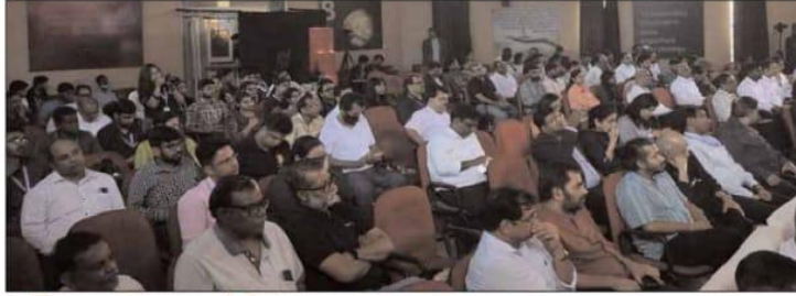
The event was organised by TEDx Kanke and XISS