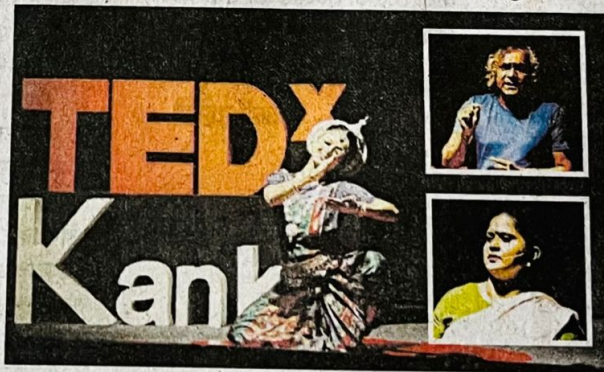
टेडएक्स के कार्यक्रम में प्रस्तुति देती नृत्यांगना और संबोधित करते वक्ता.